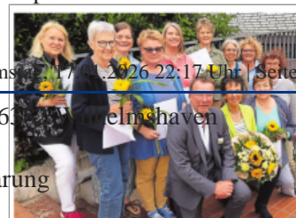
Neue Ehrenamtliche ausgebildet