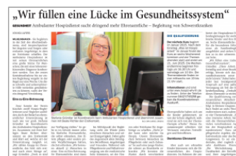
08.07.2024 Werbung neuer Kurs